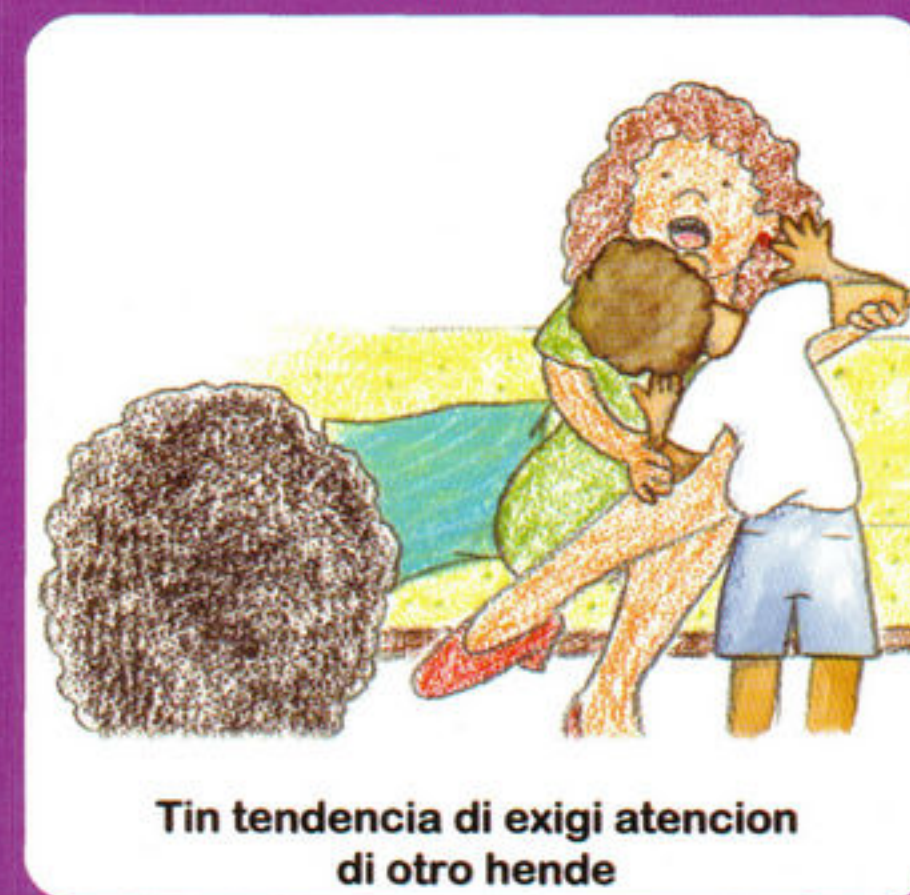
Tin tendencia di existi atencion di otro hende